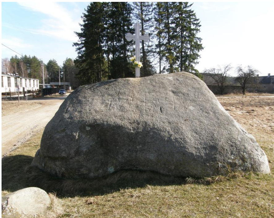
Diabelski kamień w miejscowości Owśnice koło Kościerzyny

Nasi przodkowie oddawali cześć bogom w świątyniach (zob. szczecińska kontyna), ale przede wszystkim na licznych wzniesieniach, w gajach, czy przy źródłach. Dużą rolę w kulcie pogańskim odgrywały drzewa (w szczególności dąb), zwierzęta (np. wspomniany wcześniej koń) oraz kamienie, szczególnie duże głazy, zwane często diabelskimi (na niektórych w czasach późniejszych umieszczano krzyże), które świadczą o wielowiekowej walce Kościoła z pogańskimi wierzeniami. Walka ta przyniosła Kościołowi pełne zwycięstwo, ale tylko w przypadku kultu dawnych bóstw. Nieco inaczej przedstawia się sprawa z istotami niższego rzędu, różnymi demonami i duchami (zob. temat 21, cz. II).