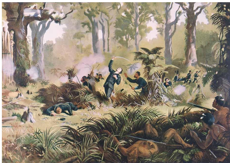
Gustav Ferdinand von Tempsky zginął w bitwie z Maorysami pod Te Ngutu o te Manu (1868). Obraz Kennetta Watkina