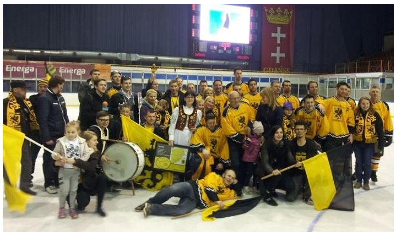
Kashubian Griffins w Gdańsku Oliwie (kwiecień 2014 r.)