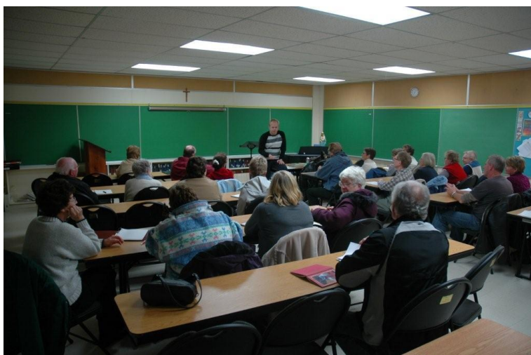
Ojczystego języka uczyli się również dorośli mieszkańcy kilku osad kaszubskich w Kanadzie